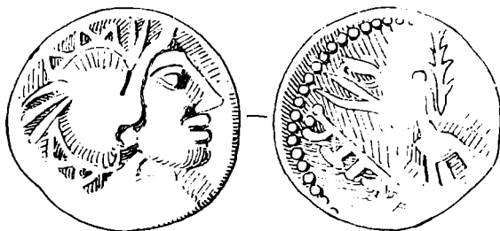
Fig. 1. Imitația locală după un denar roman.

După ancheta făcută la fața locului, rezultă că unii locuitori care au participat la lucrări în momentul descoperirii tezaurului, au reținut un număr